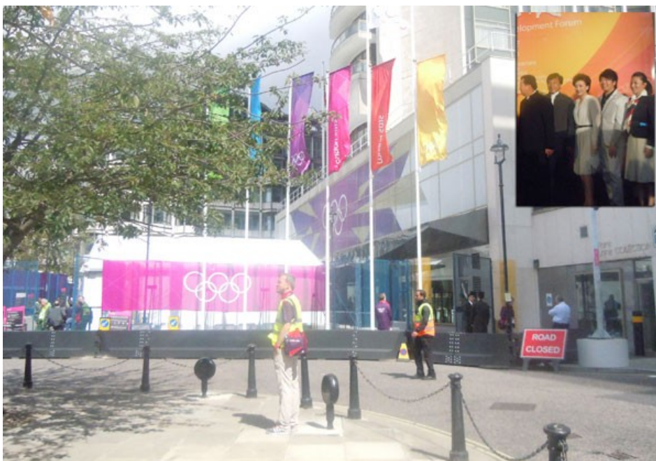
Londra (U.K.), 28 Luglio 2012: Giochi Olimpici. Conclusione della prima fase del Programma “Tv Sport Emotions” a cui avevano aderito importanti Emittenti Televisive Internazionali tra cui: CCTV – China Central Television, RAI TV, Farda Radio & Television, SVT Swedish Tv, EUROSPORT, ESPN, Czech Tv, Channel One, Benfica TV, Bulgarian National TV, Fisi Tv, Wdr Untv, Sport Pro International, African Sports Network, EVS Broadcast, Tv Malaysia, ecc.