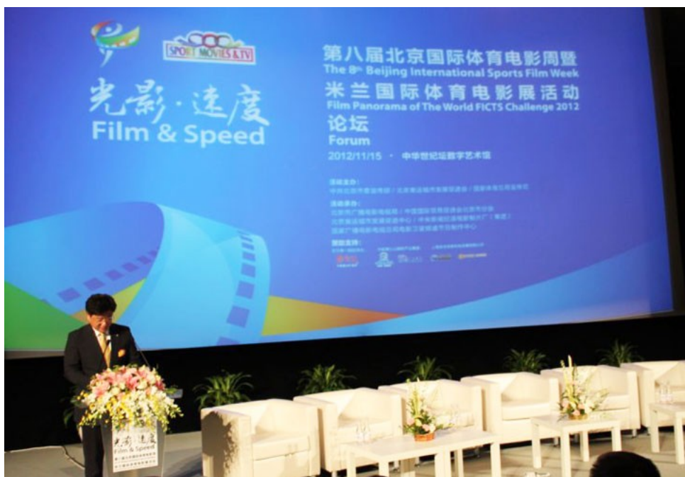
Pechino (Cina), 16 Novembre 2012 - Digital Art Museum of the Cinema Millennium Monument: FORUM INTERNAZIONALE "New sport television market trends" organizzato dalla FICTS in collaborazione con BODA nell'ambito del "30 th World FICTS Challenge – Beijing Worldwide Final of Championship of Cinema and Sport Television" (54 Paesi partecipanti dei 5 Continenti)