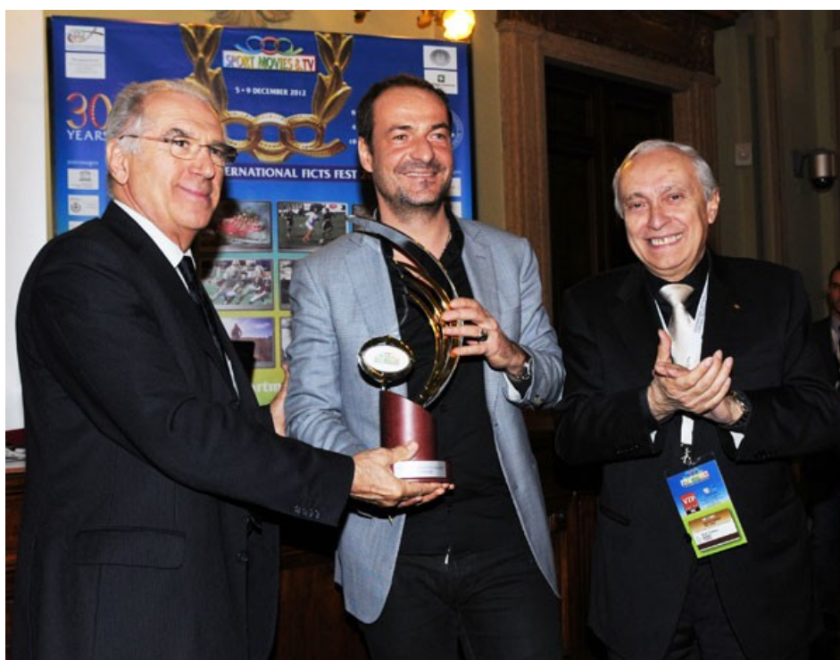
Milano (Italia), 5 - 9 Dicembre 2012: "Giornata Mondiale della Televisione Sportiva"

Il Programma "TV SPORT EMOTIONS - THE BEST OF WORLD TV SPORT" (sito: www.sportmoviestv.com/tvsportemotions ) per i Canali Televisivi Sportivi di tutto il mondo per l'assegnazione del "MIGLIOR CANALE SPORTIVO TV DELL'ANNO AWARD" (l'adesione è gratuita e non comporta alcuna spesa da parte Vostra). Lo scopo è quello di incoraggiare la produzione di programmi di qualità. Tutte le Nomination saranno premiate nell'appuntamento di Milano dal 4 all'8 dicembre 2013.